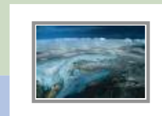
Lodowiec Folgefonn Norwegia