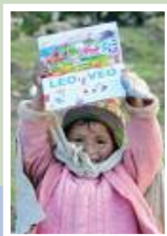
Cuyo Grande, Peru