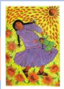
„Miłość do dzieci”