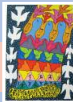
„Przeobrażanie narzędziem pokoju”