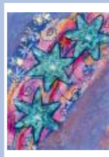
„Deszcz wirujących gwiazd”