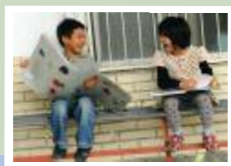
Hualian, wyspa Tajwan