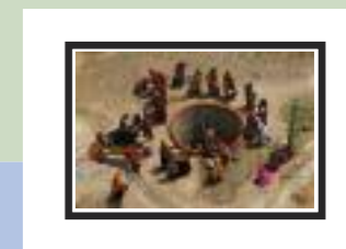
Kobiety przy studni Indie