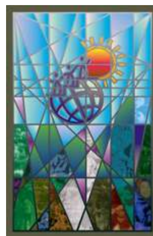
Karta Społeczna 2010