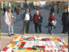
17 października 2007 - Odświeżenie płyty Praw Człowieka poświęconej ofiarom biedy w Kielcach