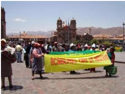
17 października 2006 w Kusko - Peru

Od roku 1987 z inicjatywy Międzynarodowego Ruchu ATD Czwarty Świat organizacje pozarządowe w wielu krajach obchodziły w dniu 17 października Światowy Dzień Sprzeciwu Wobec Nędzy. W 1992 roku Zgromadzenie Ogólne (ONZ) postanowiło ogłosić ten dzień Międzynarodowym Dniem Walki z Ubóstwem (rezolucja 47/196 z 22 grudnia).